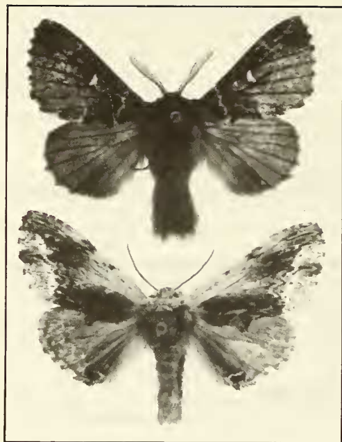
Figuur 1 : (boven) Cosmotriche lunigera Esper, Le Vic, omgeving Gérardmer (Dep. Vosges, F.), 11-vii-1982, leg. W en GDP. (onder) Ptilodontella cucullina Denis & Schiffermüller, zelfde gegevens.